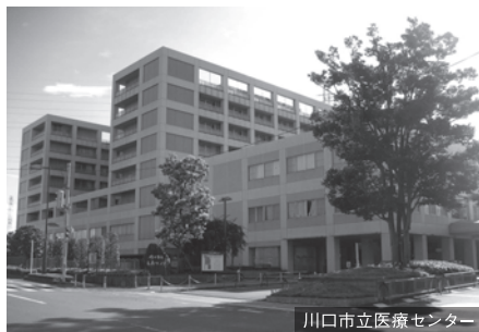
川口市立医療センター