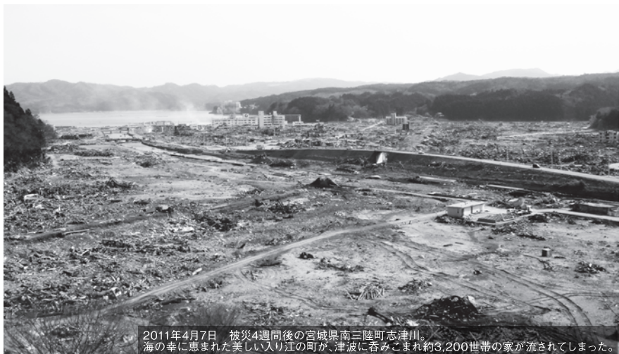
2011年4月7日 被災4週間後の宮城県南三陸町志津川。 海の幸に恵まれた美しい入り江の町が、津波に呑みこまれ約3,200世帯の家が流されました。